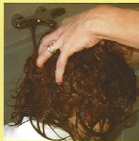
Wrijf het goed in.