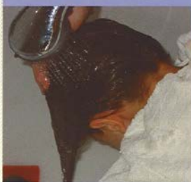
Spoel de balsem uit.