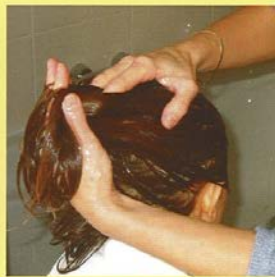
Verdeel de balsem op het haar.