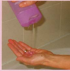
Gebruik een gewone shampoo.