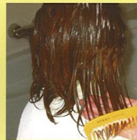
Kam het haar los.