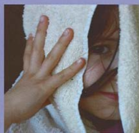
Droog het haar met een handdoek.