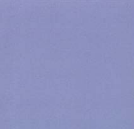
Gooi het keukenpapier weg. Spoel de kammen met heet water.