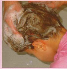
Was het haar.