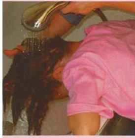
Maak het haar nat.