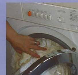
Was handdoeken, kleren en lakens op 60 graden.