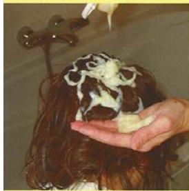
Doe veel balsem op het haar.