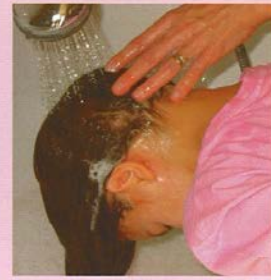
Spoel goed. Niet drogen.